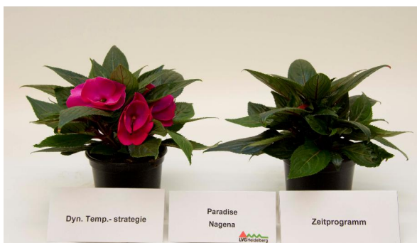
Abb. 1: 'Paradise Nagena' (links dAT; rechts AZP)