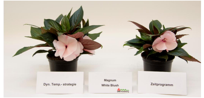
Abb. 4: 'Magnum White Blush' (links dAT; rechts AZP)