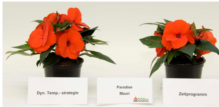
Abb. 2: 'Paradise Mauri' (links dAT; rechts AZP)