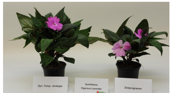
Abb. 6: 'SunPatiens Vigorous Lavender' (links dAT; rechts AZP)