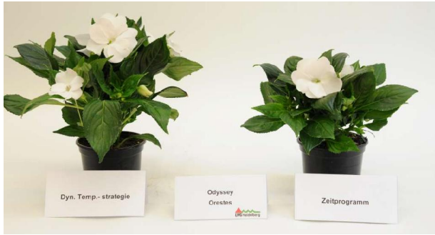
Abb. 3: 'Odyssey Orestes' (links dAT; rechts AZP)