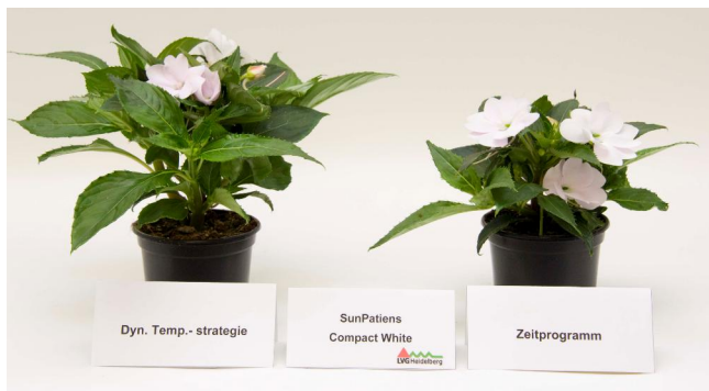
Abb. 5: 'SunPatiens Compact White' (links dAT; rechts AZP)