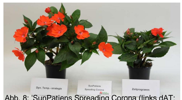
Abb. 8: 'SunPatiens Spreading Corona' (links dAT; rechts AZP)