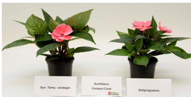
Abb. 7: 'SunPatiens Compact Coral' (links dAT; rechts AZP)