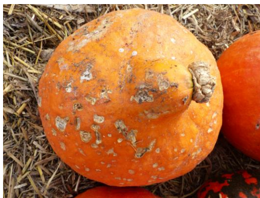
Abb. 8: Hokkaido mit Colletotrichum lagenarium .