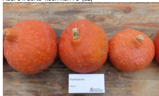
Abb. 16: Sorte 'Potimarron' (Hz)