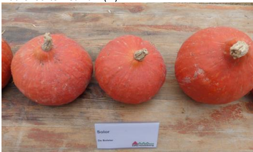
Abb.11: Sorte 'Solor' (dB)