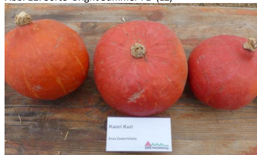
Abb. 14: Sorte 'Kaori Kuri F1' (EZ)