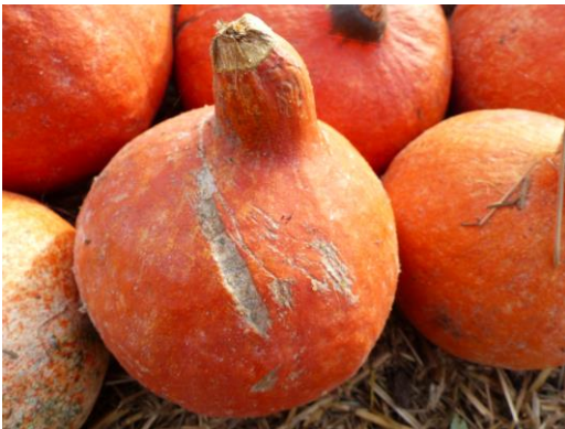
Abb. 5: Hokkaido mit geschädigter Schale.