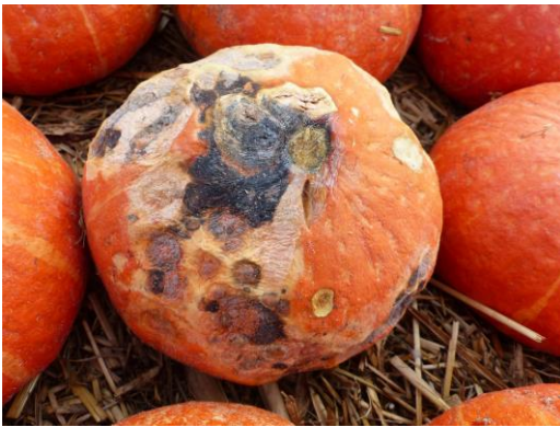
Abb. 3: Hokkaido mit Dydymella bryoniae im fortgeschrittenem Stadium.