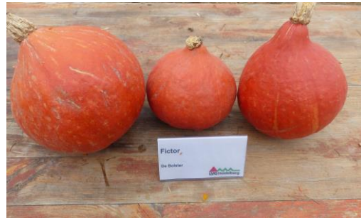
Abb. 10: Sorte 'Fictor' (dB)