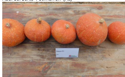
Abb. 18: Sorte 'Vesuv F1' (Hi)