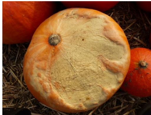
Abb. 6: Hokkaido mit Sonnenbrand.