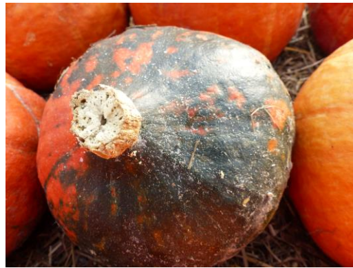
Abb. 4: Hokkaido mit Virusbefall.