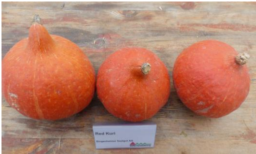
Abb. 9: Sorte 'Red Kuri' (Bi)