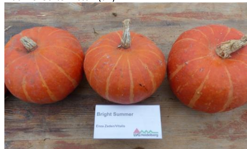
Abb. 12: Sorte 'Bright Summer F1' (EZ)