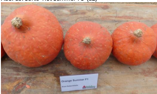
Abb. 15: Sorte 'Orange Summer F1' (EZ)