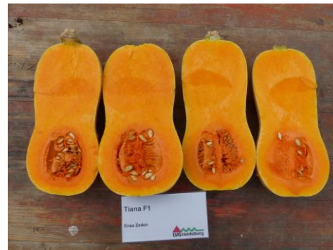
Abb. 12: Sorte 'Tiana F1' (EZ)