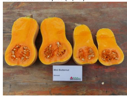
Abb. 8: Sorte 'Mini Butternut' (Rs)