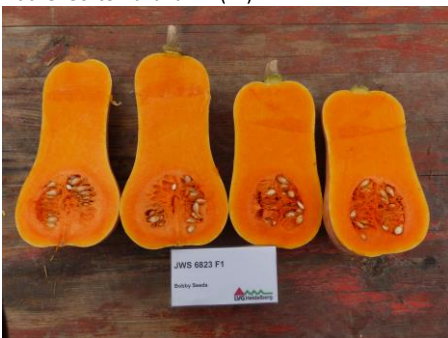
Abb. 7: Sorte 'JWS 6823' (Bobby Seeds)