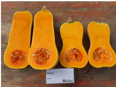
Abb. 11: Sorte 'Sibelle' (Hz)