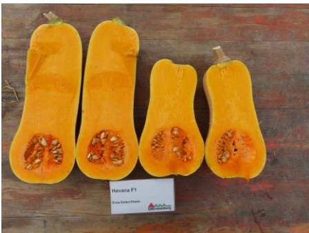
Abb. 5: Sorte Havana F1' (EZ)