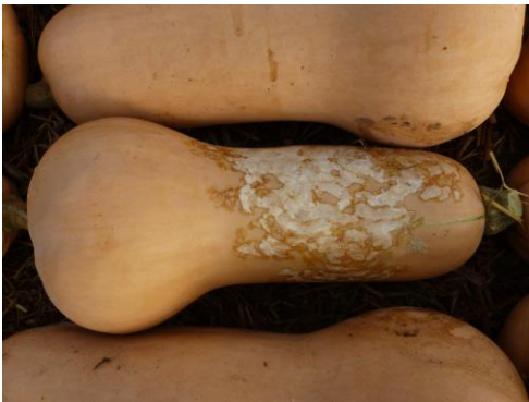
Abb. 3: Butternut mit Dydimella bryoniae