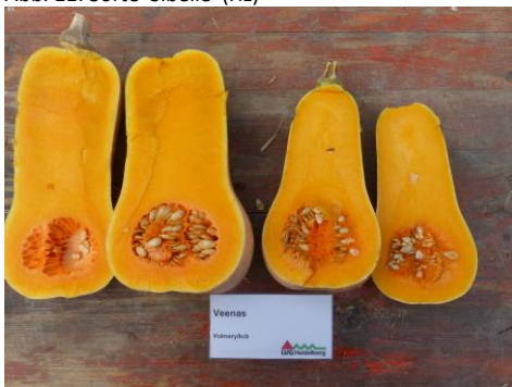
Abb. 13: Sorte 'Veenas' (Vol/Kcb)