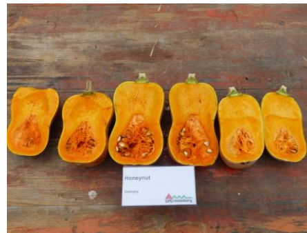
Abb. 6: Sorte 'Honeynut' (Rs/Vol)