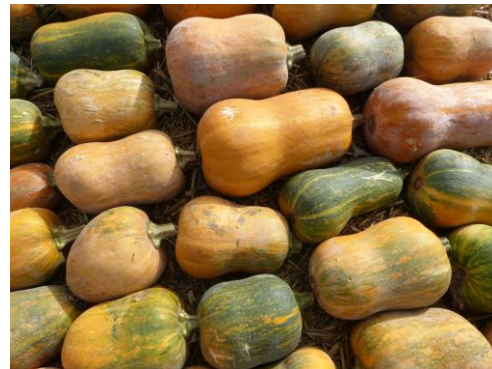
Abb. 4: Butternut-Sorte 'Honeynut' (Rs/Vol) im tlw. unreifen Zustand