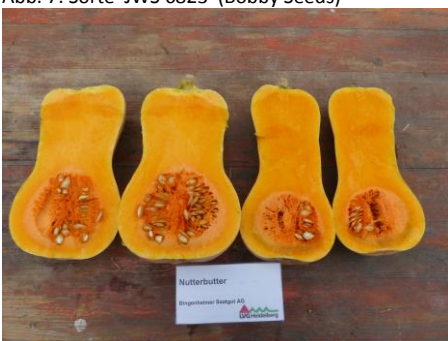
Abb. 9: Sorte 'Nutterbutter' (Bi)