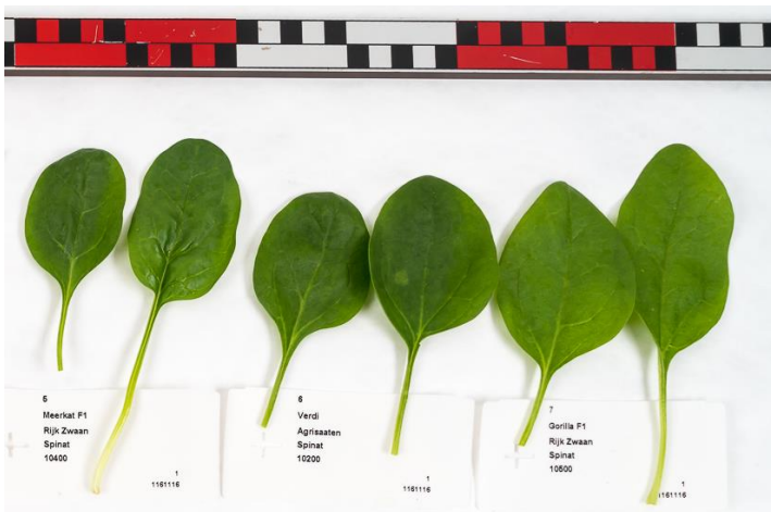
Abb. 3: Blatttypen in der Sortenübersicht; von links nach rechts: Meerkat F1 (RZ), Verdi (Ag) und Gorilla F1 (RZ).