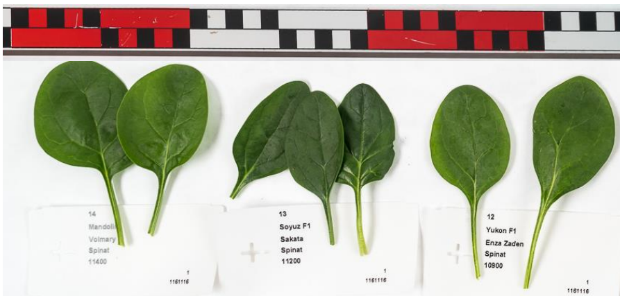
Abb. 4: Blatttypen in der Sortenübersicht; von links nach rechts: Mandolin (Vo/Pop Vriend), Soyuz F1 (Sa) und Yukon F1 (EZ).