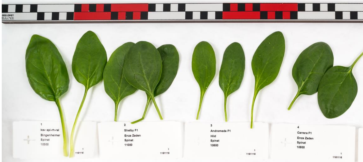
Abb. 2: Blatttypen in der Sortenübersicht; von links nach rechts: ksv spi-rh-ral (Bi), Shelby F1 (EZ), Andromeda F1 (Hi) und Carrera F1 (EZ).