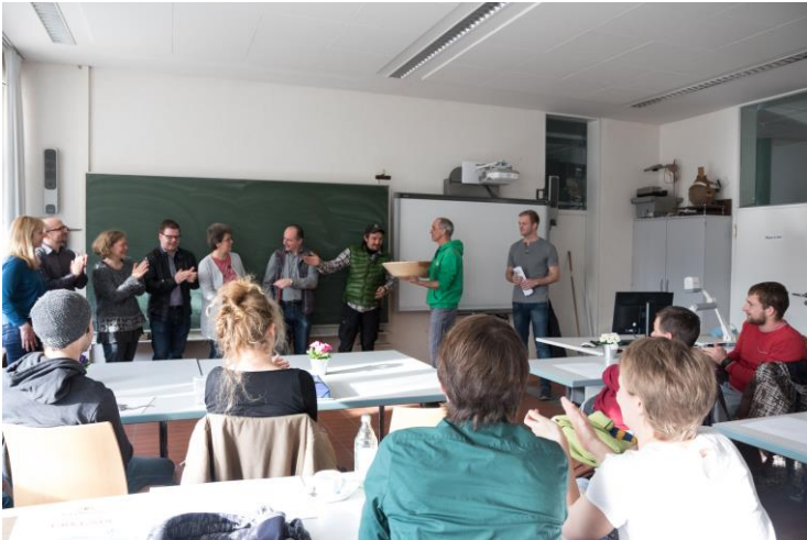
Ansprache des Klassensprechers und Dank- sagung an Lehrkräfte und Schule.