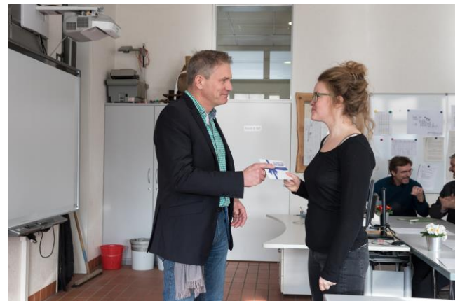
Geschenkübergabe durch den Ehemali- genverband an die Jahrgangsbeste.