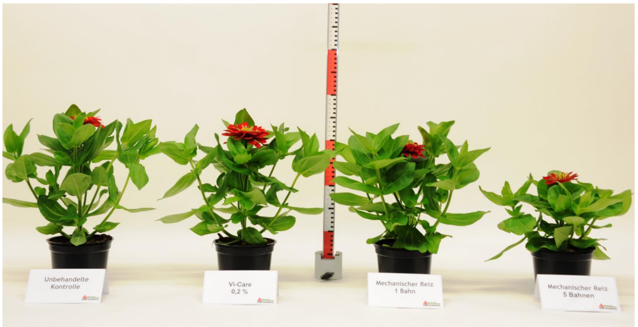
Abb. 2: Die Varianten Vi-Care® und mechanische Reiz mit einer Streichelbahn zeigten keinen signifikanten Unterschied zur Kontrolle. Die Pflanzen der Variante mechanischer Reiz mit fünf Streichelbahnen waren signifikant kleiner als die Kontrollpflanzen.