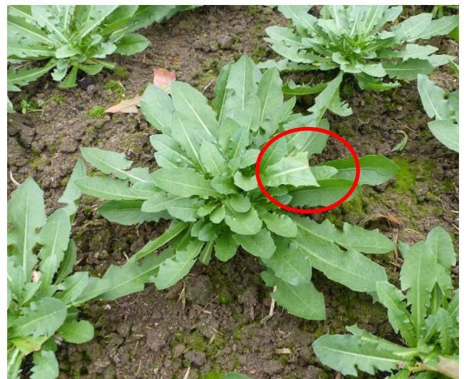
Abb. 3: Löwenzahn ( Taraxacum officinale L.), Wiederaufwuchs mit angeschnittenen Blättern.