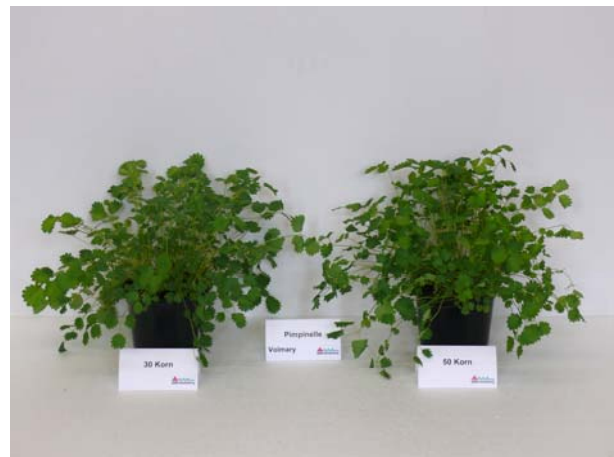
Abb. 1-8: Pimpinellesorten verschiedener Herkünfte in unterschiedlichen Aussaatdichten