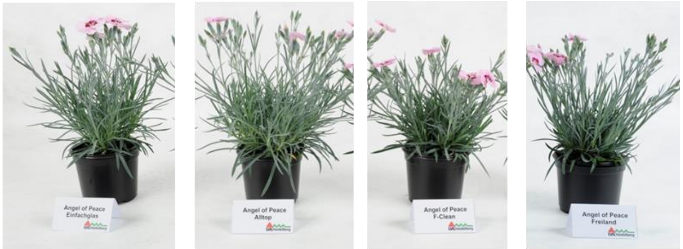
Abbildung 2: `Angel of Peace` (Volmary) – Vergleich verkaufsfertiger Ware, Fotos zum Zeitpunkt „75% der Pflanzen an einem Standort zeigen mindestens eine offene Blüte“

Von insgesamt vier getesteten Bedachungsmaterialien zeigt die Dianthus Topfsorte `Angel of Peace` die beste Qualität unter der F-Clean® Folie