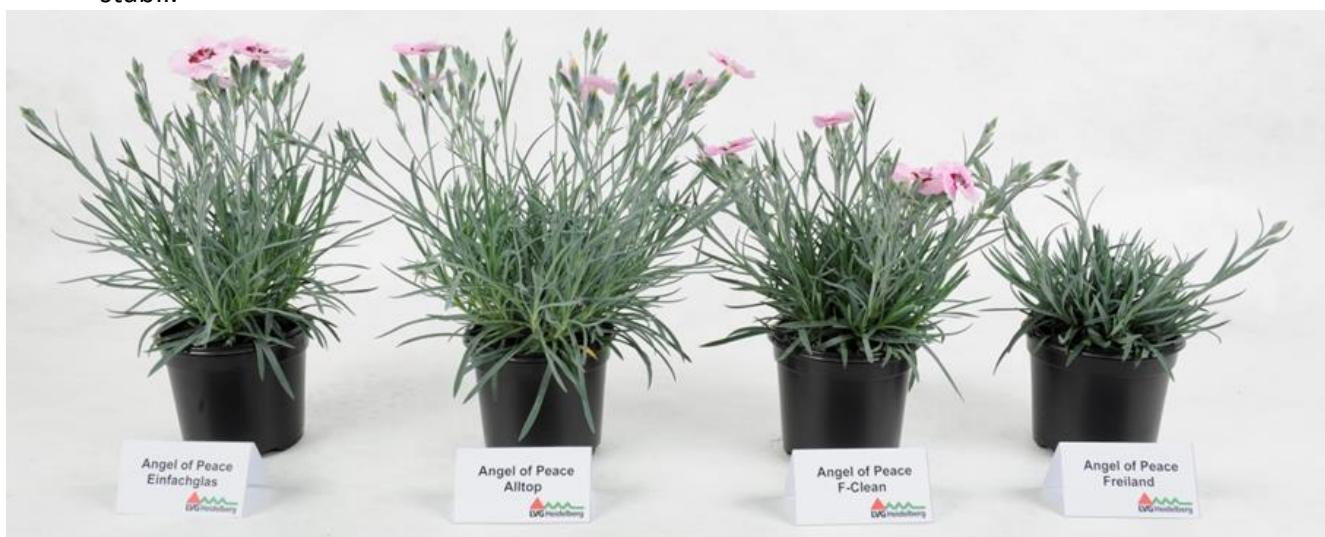
Abbildung 1: 'Angel of Peace' (Volmary) – Verzögerung der Freilandvariante (rechte Pflanze) deutlich zu erkennen, Aufnahme von Kw 19