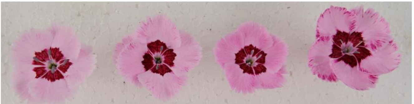
Abbildung 3: `Angel of Peace` (Volmary) – Unterschiede in der Blütenfarbausprägung und Blütengröße der verschiedenen Standorte, Reihenfolge von links nach rechts: Einfachglas, Plexiglas Alltop®, F-Clean® Folie und Freiland