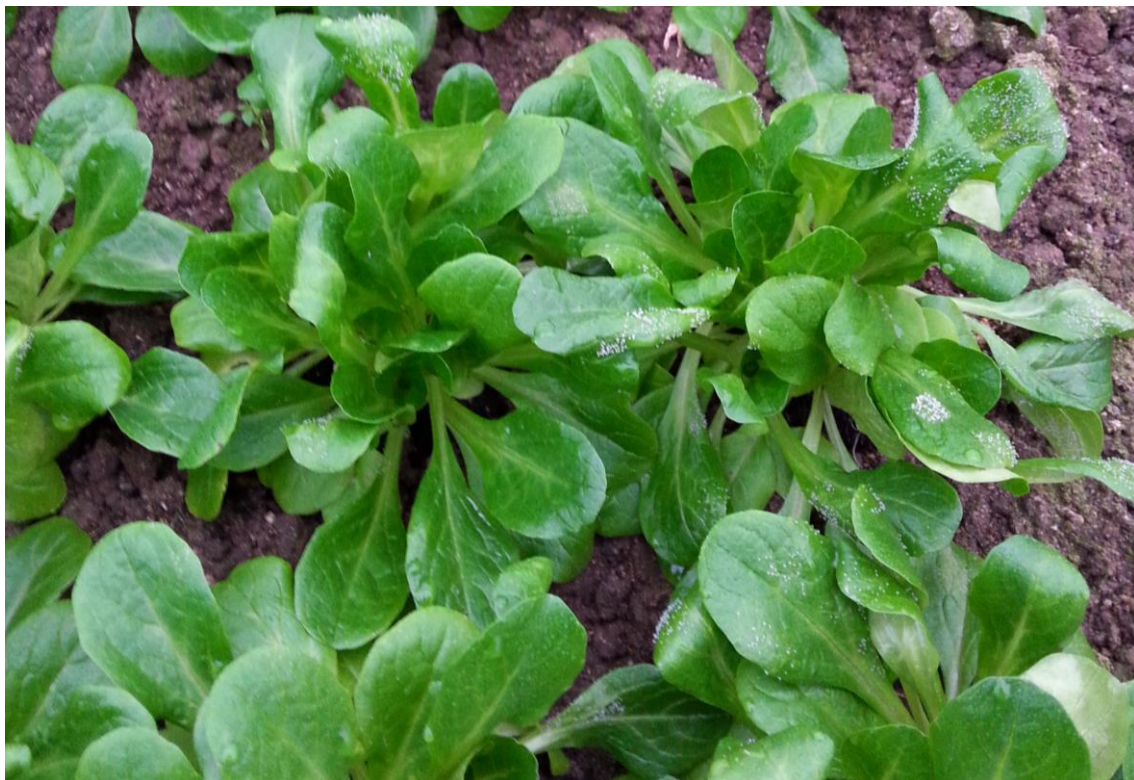
Abb. 2: Feldsalat mit Falschem Mehltau ( Peronospora vallerianellae ), Herbst/Winter 2019/2020.