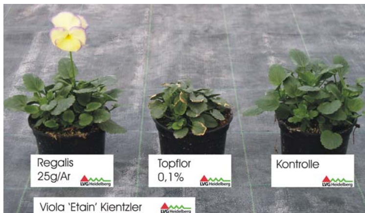
Abb.2 Wirkung von Topflor bzw. Regalis auf Viola 'Etain' (Kientzler)