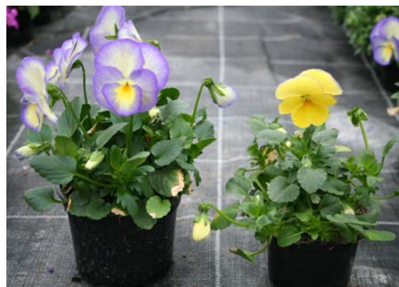
Abb.3 'Etain' (Kientzler) 4 mal Regalis (links) im Vergleich zu 'Etain' (Florensis) 2 mal Regalis (rechts)