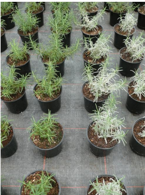
Abb. 6: Zwei Reihen der Variante „Prev“ links, zwei Reihen der Kontrollvariante rechts (KW 41)

Die Blockspritzung mit Vi-Care und Prev führte zu einem sichtbaren Befallsrückgang (Abb. 5). Dabei konnte vor allem durch die Behandlungen mit Prev die Anzahl der Töpfe mit Echem Mehltau deutlich bis unter 10 % reduziert werden. Nach ca. zwei Wochen war wieder eine Befallszunahme zu registrieren, so dass eine weitere Blockspritzung in KW 41 folgte. Hierdurch konnte in beiden Varianten ein wiederholter Befallsrückgang erzielt werden.