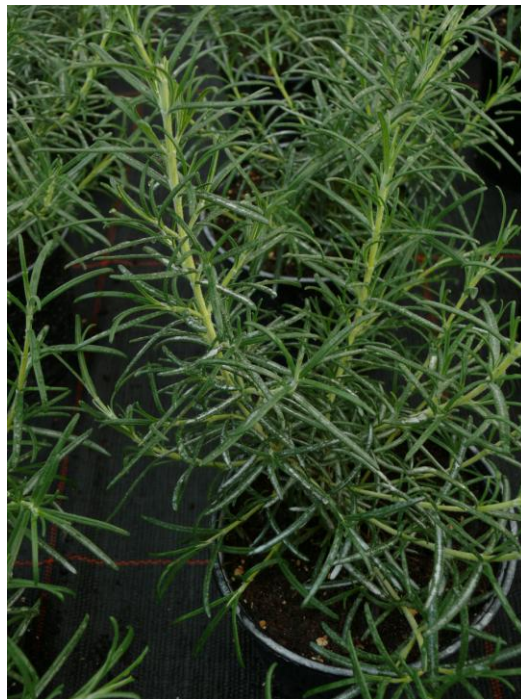
Abb. 4: Topf aus Schwefel-Variante nach Abbrausen mit Wasser