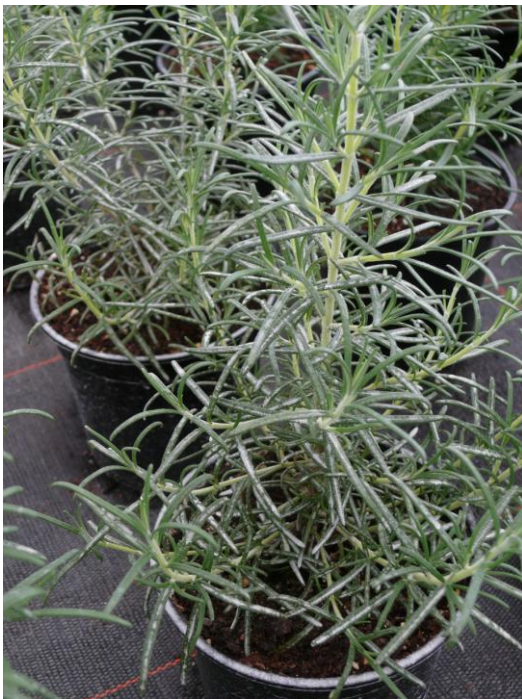
Abb. 3: Topf aus Schwefel-Variante vor Abbrausen