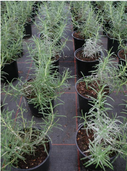
Abb. 2: Starker Befall mit Echtem Mehltau in der Kontrollvariante in KW 43

verursachte die einprozentige Ausbringung von Schwefel erhebliche Blattflecken, die auch nach zweimaligem Abbrausen zu Kulturende nicht entfernt werden konnten (Abb. 3 und 4.).