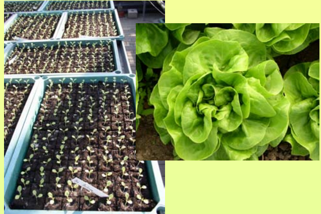
Mittlere Kopfgewichte bei Öko-Kopfsalat in Abhängigkeit von verschiedenen Pflanzenstärkungsmitteln (Sorte Roderick)

TRI 003 ( Trichoderma harzianum ): Angießen in KW 9 (Vor Pflanzung) FZB 24 ( Bacillus subtilis ): Angießen in KW 4 (1. Laubblattpaar) Elot-Vis (Pflanzenextrakte): Wöchentliche Behandlung