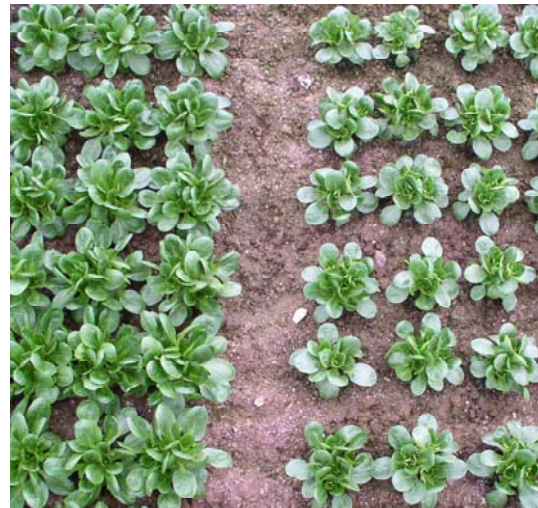
Abb. 2: Größenunterschied zwischen 'Favor' öko (EZ/Vitalis) bzw. 'Elan' öko (Bi) und 'Medaillon' öko (Hi/Nu) zum Erntetermin Ende Februar 2006