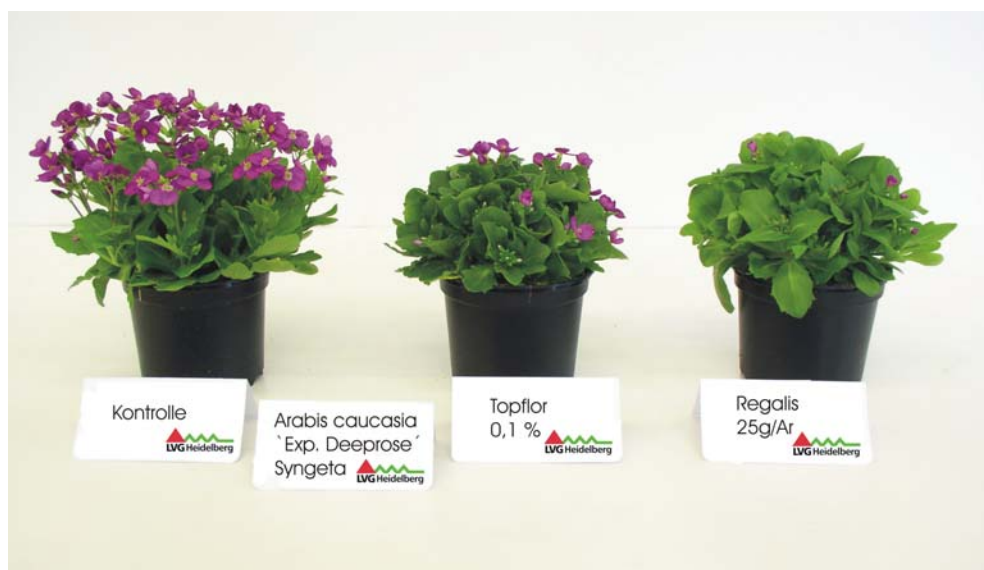
Abb.2 Wirkung von Regalis bzw. Topflor auf den Habitus von Arabis caucasica 'Deeprise' (S&G)