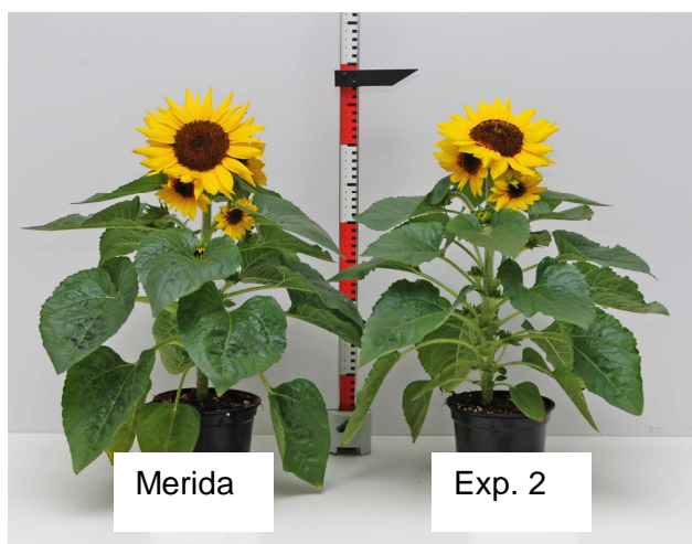
Abb.1: 'Merida' (Nebelung) und 'Exp.2'(Benary) hinterließen den besten Gesamteindruck